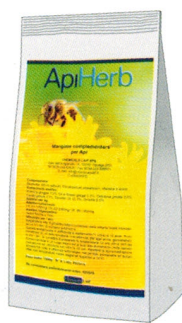
busta da 1000 g