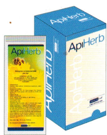
busta da 40 g (scatole da 10 buste)

a base di estratti vegetali, olii essenziali, vitamine del gruppo B