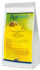
busta da 500 g